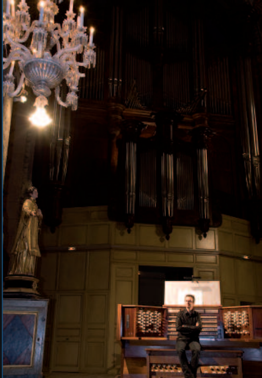
Grand Orgue de Roquevaire